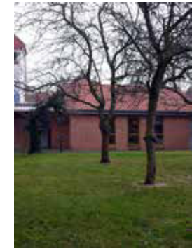
GARTENHAUS neben der Klosterkirche