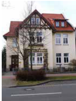
PFARRHAUS Bahnhofstr. 11a, Bückeburg