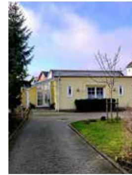
GEMEINDEHAUS Bahnhofstr. 11a, Bückeburg