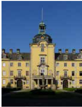
SCHLOSSKIRCHE Schloss Bückeburg