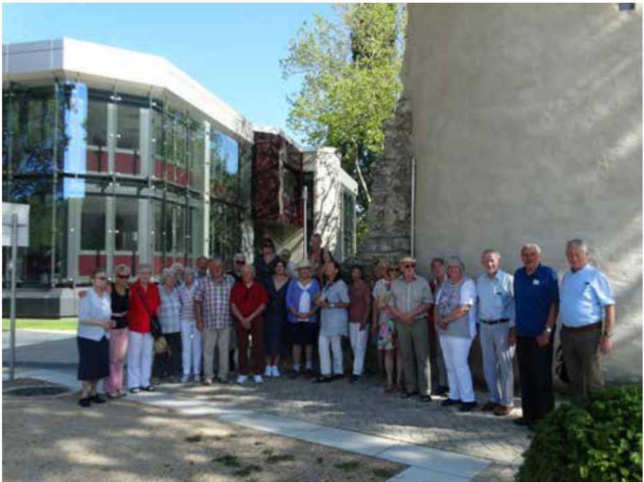
Unsere Gemeindefahrt nach Paderborn am 23. Juni 2019