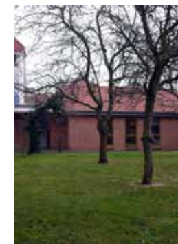
GARTENHAUS neben der Klosterkirche